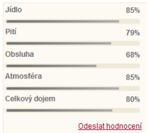
Obr. 40 – Odeslat hodnocení