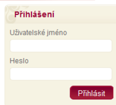
Obr. 30 – Box přihlášení

Po ukončení práce s portálem by se měl každý uživatel odhlásit ze systému. Tento krok je důležitý hlavně pokud počítač, na kterém je uživatel přihlášen, využívá více osob. Z důvodu ochrany osobních údajů či případné změny v nastavení Vašeho profilu doporučujeme, aby se každý uživatel po dokončení práce s portálem odhlásil ze systému. Odhlášení se provede kliknutím levého tlačítka myši na odkaz „odhlásit“ v pravém horním rohu aplikace – v místě pro zobrazení informací o přihlášeném uživateli (viz. Obr. 31 – Informace o uživateli). Po úspěšném odhlášení se zobrazí domovská stránka portálu a v informacích o přihlášeném uživateli bude zobrazeno „Uživatel nepřihlášen“.