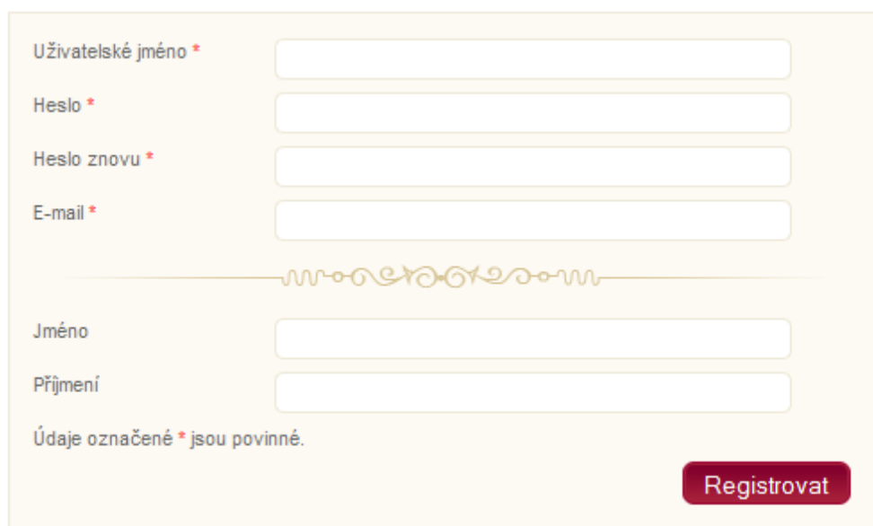
Obr. 29 – Registrační formulář