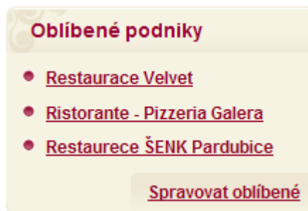
Obr. 34 – Box oblíbených podniků

Podnik přidáte mezi své oblíbené jednoduše kliknutím na ikonu hvězdičky označující přidání mezi oblíbené podniky v seznamu nalezených podniků (viz. Obr. 16 - Seznam nalezených podniků – pod fotografií) nebo v detailu podniku (viz. Obr. 17 – Detail podniku – v horní části prostředního sloupce). Je-li podnik ve Vašich oblíbených, ikonka hvězdičky se zeleně označí a funkce této ikonky se obrátí, tedy kliknutím na ní se podnik vymaže z Vašich oblíbených. Seznam všech svých oblíbených podniků naleznete ve Vašem profilu v boxu „Oblíbené podniky“ (viz. Obr. 34 – Box oblíbených podniků). Kliknutím na tlačítko „Spravovat oblíbené“ v tomto boxu se zobrazí seznam oblíbených podniků, kde je možné podniky vymazat z oblíbených (ikonka křížku) a upravovat jejich nastavení (ikonka tužky) (viz. Obr. 35 – Správa oblíbených podniků).