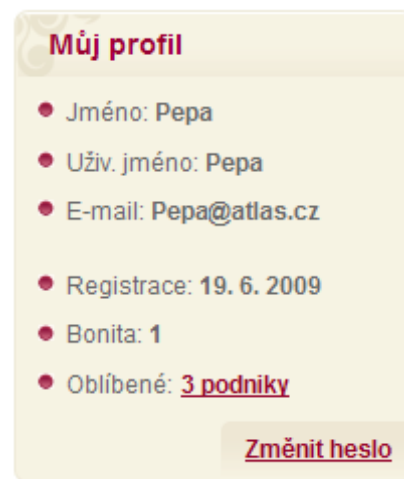
Obr. 33 – Profil uživatele

Během vyhledávání podniků je možné ukládat vybrané podniky jako Vaše oblíbené. Poté se zobrazí ve Vašem profilu a Vy máte možnost jejich správy v podobě nastavení zaslání upozornění na speciální akce či zaslání denního menu na zvolený email.