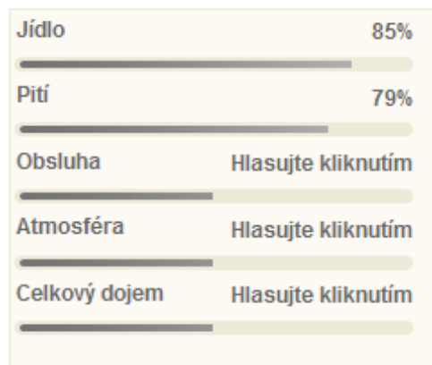
Obr. 39 - Hodnocení