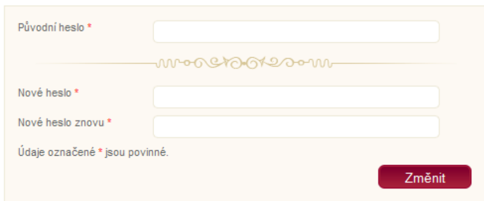
Obr. 32 – Formulář pro změnu hesla

uložit heslo s překlepem a následným problémem s přihlášením do systému. Vyplňte formulář a změnu potvrďte kliknutím na tlačítko „Změnit“ v pravém dolním rohu formuláře (viz. Obr. 32 – Formulář pro změnu hesla). Následně se objeví zpráva o změně hesla a od této chvíle se budete do systému přihlašovat pomocí nového hesla.