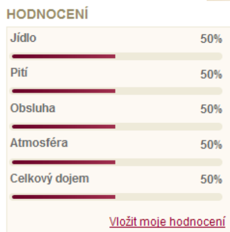
Obr. 38 – Vložit hodnocení

V detailu každého podniku se zobrazuje jeho hodnocení získané od uživatelů portálu. Hodnocení je rozděleno do několika kategorií, proto je možné na první pohled zjistit, co je dominantou podniku. Pokud jste navštívili daný podnik a máte zájem jej ohodnotit, musíte být přihlášen. Po přihlášení do systému se Vám v pravém dolním rohu boxu hodnocení zpřístupní odkaz „Vložit moje hodnocení“ (viz. Obr. 38 – Vložit hodnocení). Kliknutím na tento odkaz všechny kategorie hodnocení zešednou a nastaví se na stejnou hodnotu 50 %. Nyní je možné nastavit v každé kategorii Vaše hodnocení procentuálním vyjádřením v rozmezí 0 až 100 %. Pro nastavení Vašeho hodnocení klikněte do vodorovného grafu požadované kategorie na přibližné místo požadované hodnoty, tím se zobrazí nastavená hodnota (viz. Obr. 39 - Hodnocení). Tuto hodnotu je možné nadále měnit, dokud neodešlete Vaše hodnocení kliknutím na odkaz „Odeslat hodnocení“ zobrazený v pravém dolním rohu boxu hodnocení (viz. Obr. 40 – Odeslat hodnocení). Tento odkaz se zobrazí až po nastavení vlastního hodnocení ve všech kategoriích. Za ohodnocení podniku se zvýší Vaše bonita (viz. kapitola 5.3.1). Každý podnik lze hodnotit právě jednou,